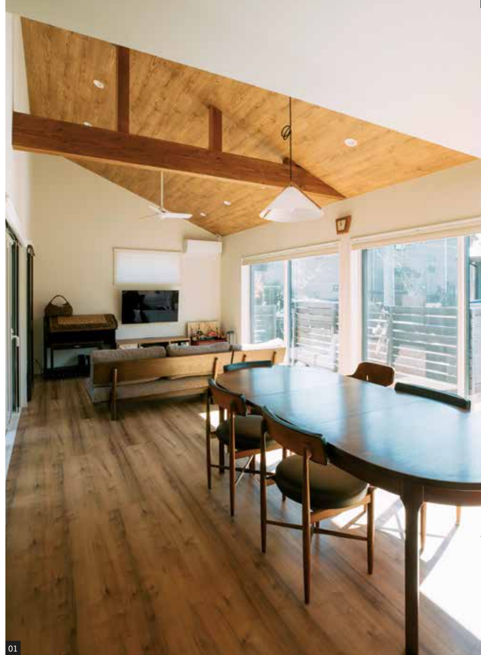
1.平屋ならではの高い天井が抜群の開放感をもたらすリビングダイニング。ナチュラルな木の質感も心地よい 2.リビングからフラットにつながるテラス。子どもが遊ぶスペースだけではなく、気持ちの良い日射しが注ぎ込み、住まい全体を明るくしてくれる 3.キッチンにはカウンターを造作。奥様の家事スペースや家族のPCコーナー、また子どものスタディスペースと多彩に活用できる 4.「私の定位置です」と、ウッドデッキはご主人のお気に入りの場所(このページの写真はすべてM邸)